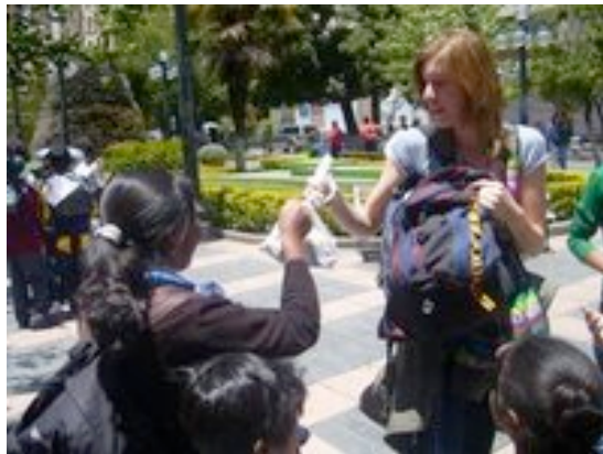
Elske deelt uit.