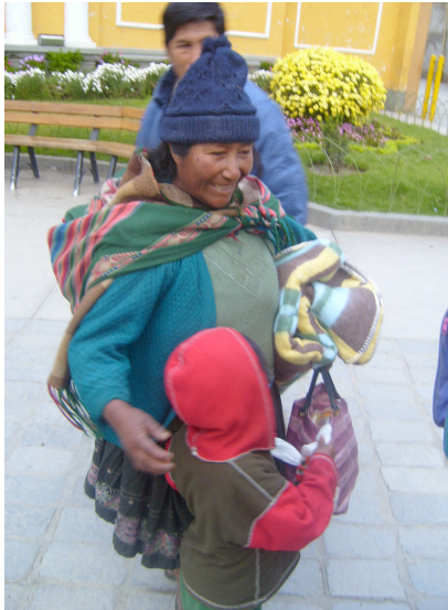
Vrouw blij met deken!